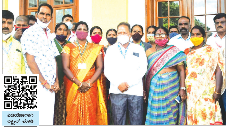
ಕೊರೋನಾ ಸೋಂಕು ಹಿನ್ನೆಲೆಯಲ್ಲಿ ಮದರ್ ವುಡ್ ಆಸ್ಪತ್ರೆಗೆ ಅಭಿಯಾನದ ಮೂಲಕ ಮಕ್ಕಳಿಗೆ ಲಸಿಕೆ ನೀಡುವ ಅಭಿಯಾನಕ್ಕೆ ಗೊಂಡಿದೆ.