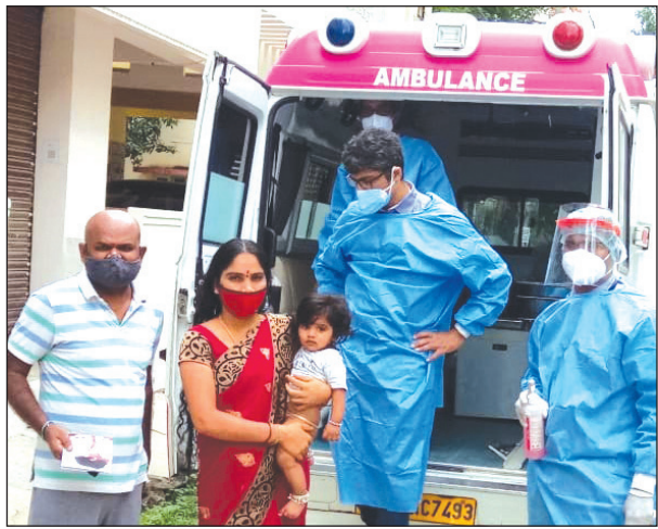
ಕೊರೋನಾ ಸೋಂಕು ಹಿನ್ನೆಲೆಯಲ್ಲಿ ಮದರ್ ವುಡ್ ಆಸ್ಪತ್ರೆಗೆ ಅಭಿಯಾನದ ಮೂಲಕ ಮಕ್ಕಳಿಗೆ ಲಸಿಕೆ ನೀಡುವ ಅಭಿಯಾನಕ್ಕೆ ಗೊಂಡಿದೆ.

ಬೆಂಗಳೂರು, ಜೂನ್ 23, 21: ಕೋವಿಡ್-19 ಸಾಂಕ್ರಮಿಕ ರೋಗದ ಎರಡನೇ ಅಲೆಯ ನಡುವೆ ಪೋಷಕತೆ ಮತ್ತು ಮಕ್ಕಳಿಗೆ ವಾಡಿಕೆಯಂತೆ ರೋಗನಿರೋಧಕ ಮತ್ತು ಪೂರ್ಣ ಲಸಿಕೆ ಕೊಡಿಸಲು ಆಸ್ಪತ್ರೆಗೆ ಕರೆದೊಯ್ಯುವ ಬಗ್ಗೆ ಚಿಂತೆಗೊಳಿಸಿದ್ದಾರೆ.